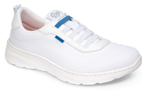
ALICANTE pág. 2 SANITÀ/RISTORAZIONE