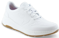
DUNA pág. 1 SANITÀ/RISTORAZIONE