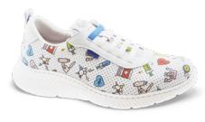
ALTEA PLUS ESTAMPADO pág. 5 SANITÀ