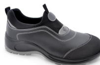
FLEXILE PLUS pág. 53 SICUREZZA