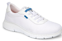
ATLANTA pág. 3 SANITÀ/RISTORAZIONE