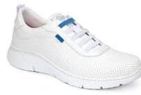
ALTEA PLUS pág. 4 SANITÀ/RISTORAZIONE