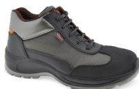
CAIRO pág. 49 SICUREZZA